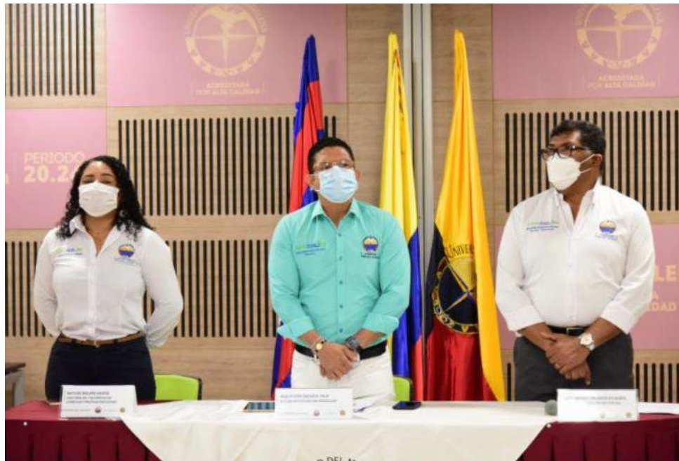
Instalación del evento